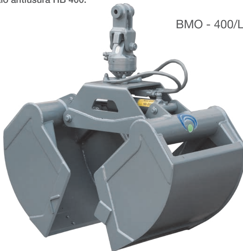
BMO - 400/L